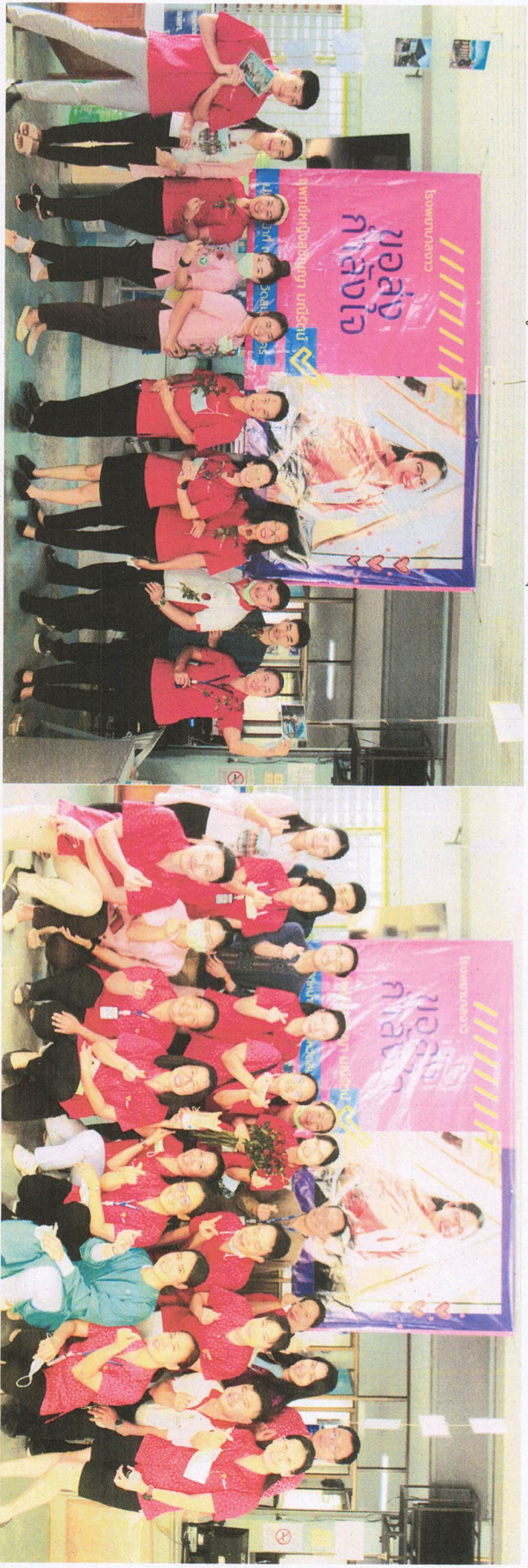
๑. โครงการจิตอาสาทำความดีด้วยหัวใจ (อาสาช่วยผู้ประสบภัยโรคระบบไตไต ๑๙ จ.สมุทรสาคร) รายงานกิจกรรมของชมรมส่งเสริมจริยธรรมและสืบสานวัฒนธรรมท้องถิ่น ประจำปีงบประมาณ ๒๕๖๔